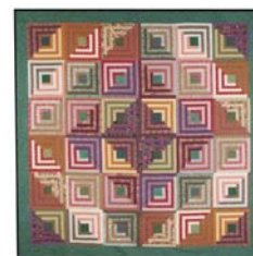
Exempel på LogCabinquiltar

Four fat quarters yield four 13" Log Cabin blocks in less than two hours! Unlike scrap Log Cabin quilts that feature a different fabric in every strip of a block, this scrap Log Cabin quilt depends on orderly repetition of fabrics within each block. Learn a great method for cutting and sewing that makes these blocks fast and, better yet, square. The four blocks you make in class can be the start of a big quilt or a very satisfactory wallhanging approximately 30" square.